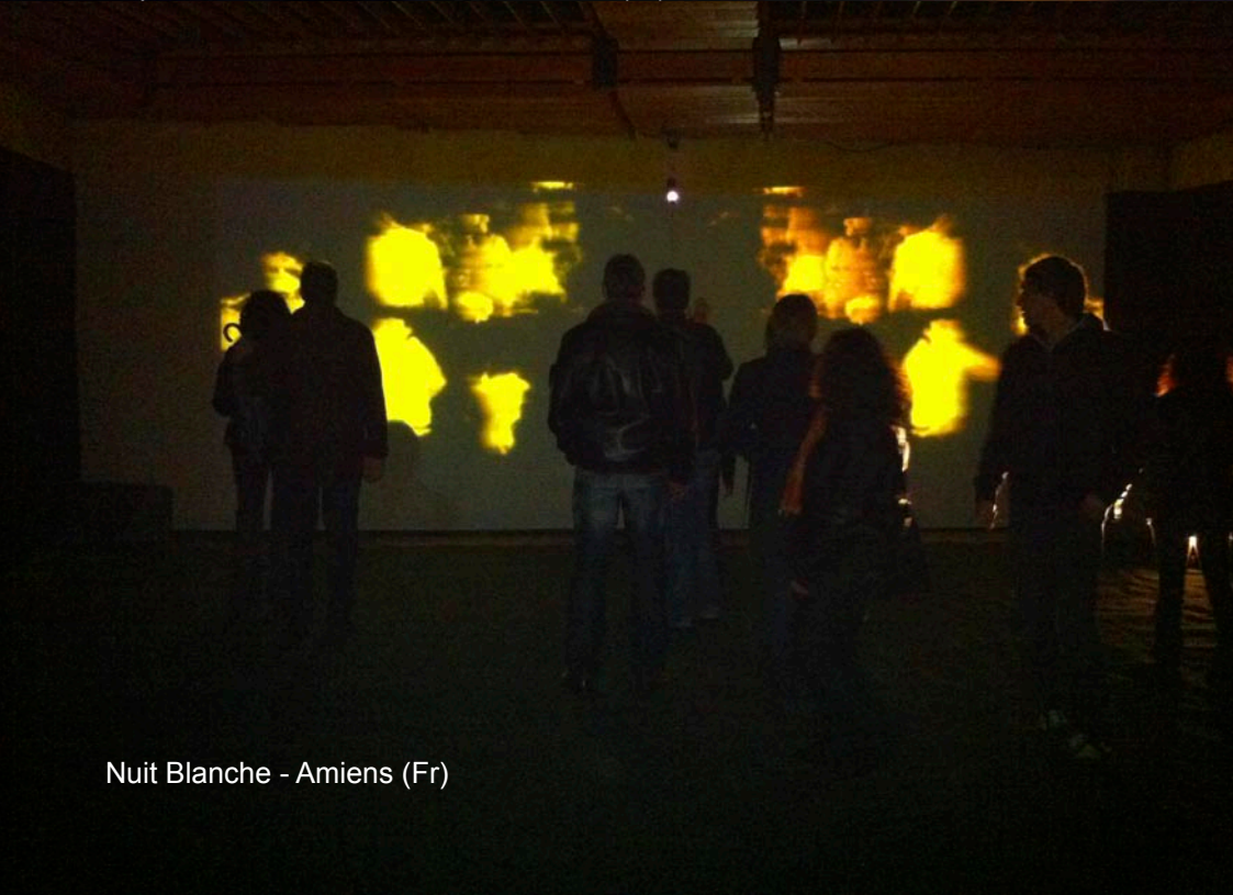
Nuit Blanche - Amiens (Fr)