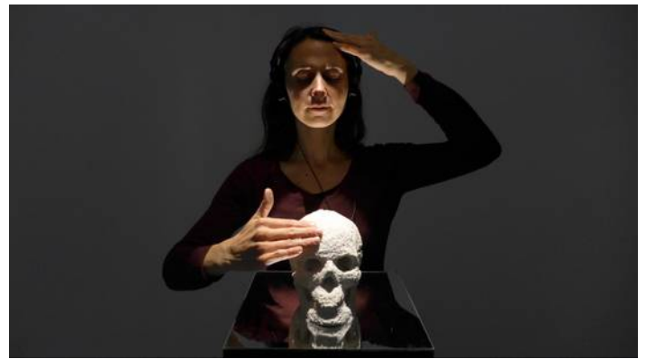
Cogito ergo sum

Le spectacle proposé ressemble à un rêve – un rêve inouï, symbolique, voire mystique – qui est une reconnexion avec les forces de la nature et une prise de conscience de la relation qui nous y lie indéfectiblement.