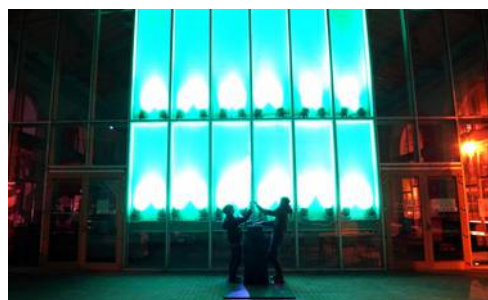
Urban Lights contacts

Toutes ces relations sont subtiles, apaisées, apaisantes. L'interaction est la mise en branle d'une synergie, un attouchement doux, un appel à la suspension du rythme mondain et à la rencontre du tout autre : non pas la nature objective avec laquelle on interagit – mais l'énergie invisible qui relie tous les êtres, notre milieu (2).